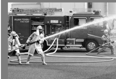
消防署と消防団の連携を確認（総合火災防御訓練）