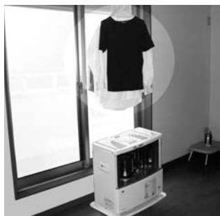
ストーブ上方に衣類などを干すのは危険！

これから寒い季節となり、暖房器具を使用する機会が増えます。石油ストーブは使用中に給油すると、灯油がこぼれて引火、