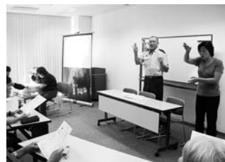
受講者から多くの質問がありました

9月2日に市民福祉活動センター「ばれっと」で、手話通訳とOHPを使用した要約筆記通訳を行いながら、指令課職員が聴覚障害者の緊急時連絡方法を講義しました。