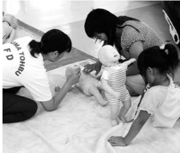
多くの方が心肺蘇生法などを体験しました

10月11日にダイエー三芳店を会場に、救急フェアを開催しました。訪れた方々は、真剣な表情で応急処置や心肺蘇生法を体験しました。