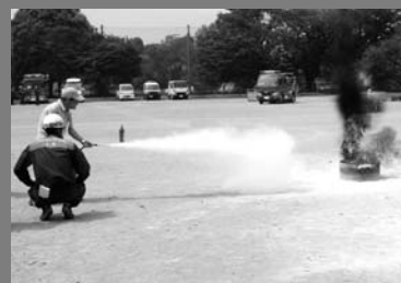
消火器による初期消火訓練（入間東部地区合同防災訓練）

8月29日にふじみ野市立さぎの森小学校で行われた入間東部地区合同防災訓練では、富士見市・ふじみ野市・三芳町の住民のほか、消防署、消防団、市や町など、災害時における各機関の連携を訓練しました。