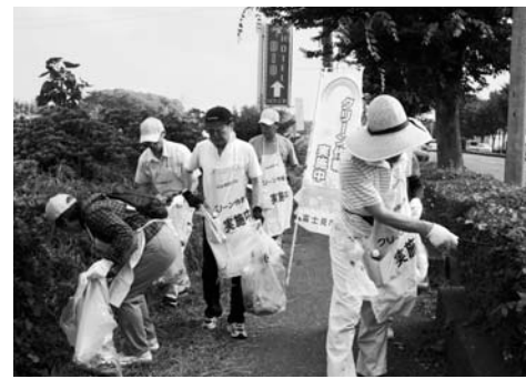
クリーン作戦（水谷ブロック）

問 自動車内での喫煙もダメですか 答 自動車内や個人の家などは喫煙を禁じていません。ただし、車から手を出して喫煙することは火の問題や受動喫煙の問題もあります。また吸い殻を投げ捨てることは違法です。 問 路上喫煙や投げ捨ての罰則はありますか 答 富士見市では条例に罰則を設けていません。違反者を取り締まるのが目的ではなく、マナーの基本に立ち戻り、路上喫煙をやめていただきたいと考えています。ただし、ごみの投げ捨てに関しては条例などで処罰される可能性があります。