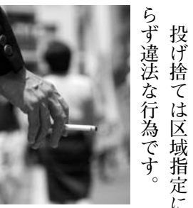
路上での喫煙には気付かぬ危険や迷惑がいっぱい

問 市外の人も、条例を守らなければならぬのですか 答 滞在または通過する方などすべての方が対象です。 特に、近隣のふじみ野市や三芳町にお住まいの方や、通勤・通学されている方に条例の趣旨