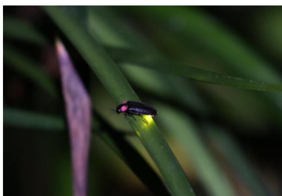
平成27年度採択協働事業 すわの森環境保全事業