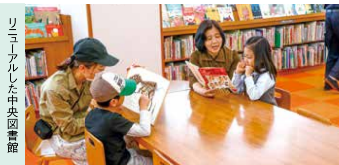
リニューアルした中央図書館