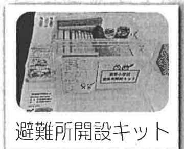
避難所開設キット