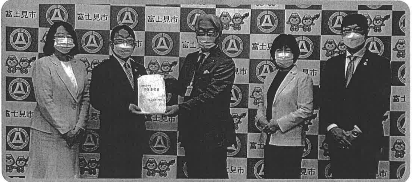
やましたよしこ しのだつよし ほしのみつひろ ふかせゆうこ しのはらみちひろ 左から山下淑子議員、篠田 剛議員、星野光弘市長、深瀬優子議員、篠原通裕議員