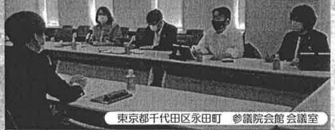
東京都千代田区永田町 参議院会館 会議室

ワクチン集団接種会場のシュミレーションを視察しました。また令和3年4月23日から始まり起こった課題について、健康福祉部長や健康増進センター所長と改善に向けて意見や情報交換を行いました。