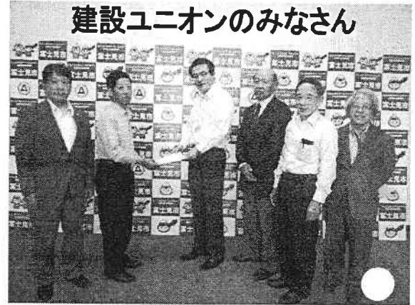
建設ユニオンのみなさん

公契約条例の制定に向けて、首都圏建設ユニオン埼玉支部の皆さんと、建設労働者の生活を守ることや、適正で安全な建物をつくるための公契約の内容の意見交換。また、災害時の、建設関係者との迅速な協力体制など、話し合いが行なわれました。今後も、協議していくことを約束しました。