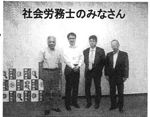
社会労務士のみなさん

予算審議のなかでは、新年度から適正な労働環境のもとに行なわれているのかの確認を実施する。また、最低制限価格制度を導入するとの答弁を頂きました。