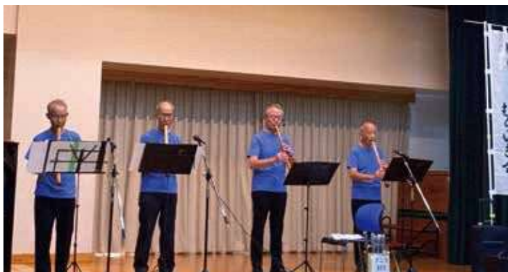
No.98 現代尺八むらいき会さん