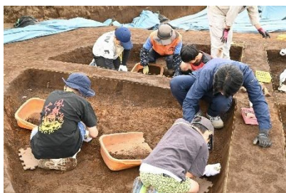
遺跡の調査を体験