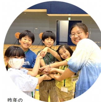
昨年の淑徳大学探検