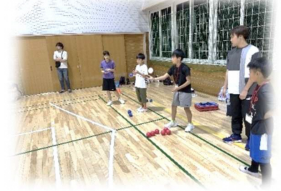
昨年のポッチャの様子

子どもスポーツ大学では、7日間の講義すべてで同じ班のお友だちとスポーツを体験するから、みんな自然と仲良くなれるよ!また、サポートしてくれる大学生のお兄さん・お姉さんもいるから安心して参加してね♪ やったことのないスポーツでも大丈夫!どの講義もはじめての人向けに教えるから、それぞれのスポーツの基本を楽しみながら学べるよ!