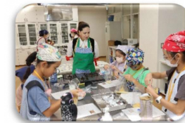
昨年はセルビア共和国の伝統料理を作りました!

その気持ち、わかる…でも大丈夫! 子ども文化芸術大学☆ふじみは、班のお友だちや大学生のお兄さん・お姉さんと楽しみながら講義を受けられるよ。 やったことのない体験も安心して♪どの講義も、初めての人にわかるように教えてもらえるから、ホンモノに触れながら新しい発見・学びになるよ。