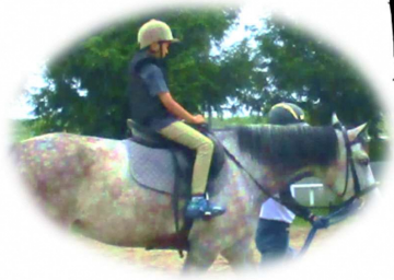
乗馬に挑戦してみよう!