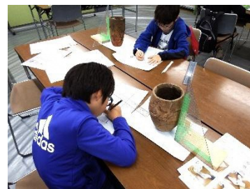
資料の調査・研究