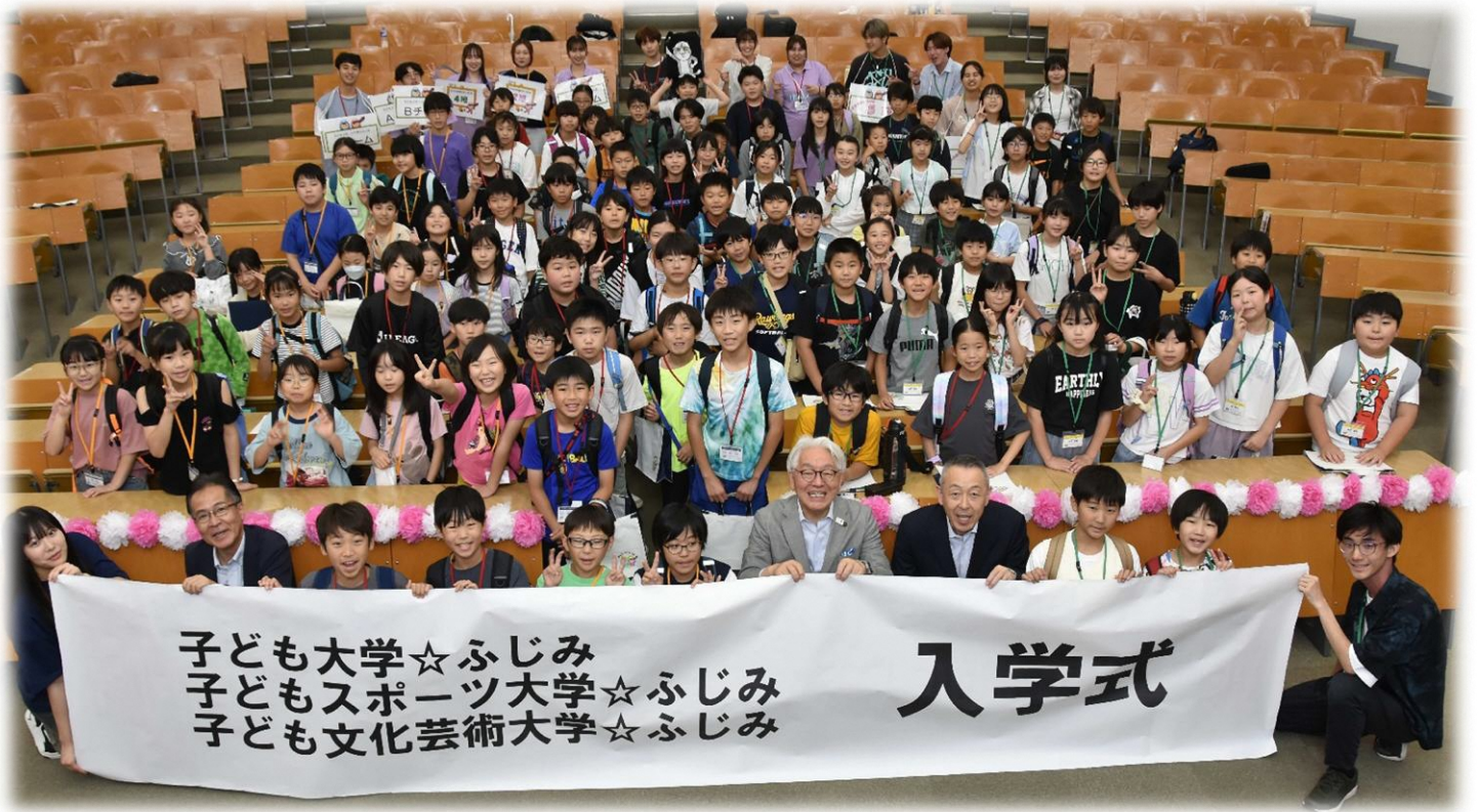
令和 7 年度入学式:全体写真