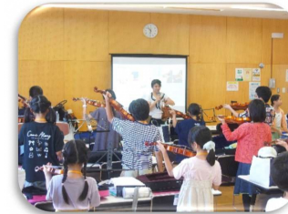
バイオリンを演奏してみよう!

普段のおうちや学校ではなかなか体験できないことが盛りたくさん!ペイントや油絵、食文化、バイオリン、表現や演劇など、幅広い文化芸術を体験することができるよ。初めてのことにたくさん挑戦して、新しい発見を探してみよう!