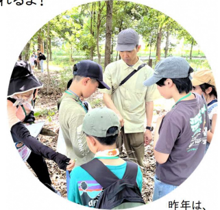
昨年は、立教大学の先生が自然観察について教えてくれました☆

立教大学・跡見学園女子大学の先生や、地元の銀行や工場、消防署のみなさんなど、いろいろな先生から、さまざまなことを教えてもらう予定です！ここ富士見市で、たくさんのことを楽しく学んで、未来への“わ”を広げよう！