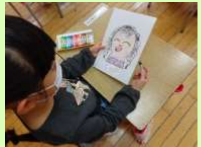
楽しく授業に取り組む1年生

さて、令和4年度のつるせ台小学校がスタートしてから早1か月が過ぎようとしています。つるせ台っ子は、新しい環境にも慣れてきて、生き生きと学習に取り組んでいます。1年生は、入学式で話したこと（①ありがとうを言う②話をしっかり聞く③あいさつをする）を意識して笑顔で生活しています。これからも全校児童が自分の夢に向かって主体的に取り組んでいってほしいと思います。