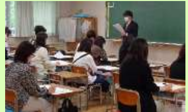
懇談会のようす（中学年）

今月もつるせ台小学校の教育活動へのご理解ご協力をどうぞよろしくお願いいたします。