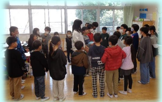
最後のハピ-タイムで6年生に感謝の気持ちを伝えて