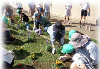
4年生 ハキマの植え付け&花壇の手入れ