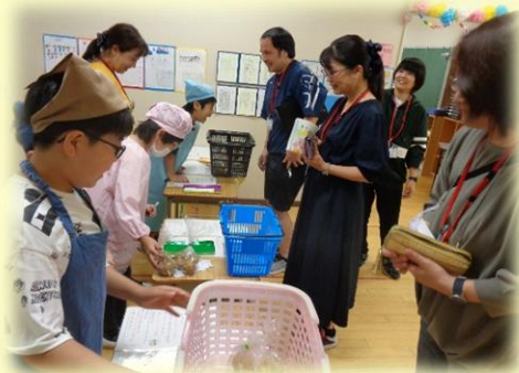
ひまわりショップでお店体験

7月もつるせ台小学校の教育活動へのご理解ご協力をどうぞよろしくお願いいたします。