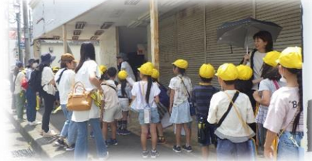
2年生 町探検の見守り