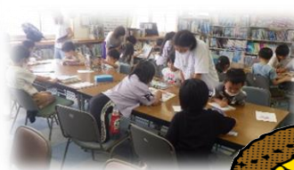
1年生 親子読み聞かせ会