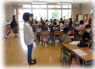
5年生 家庭科裁縫手伝い

暑い中にもかかわらず、たくさんの方にご協力いただきました。本当にありがとうございました。この後もどうぞよろしく願いいたします。