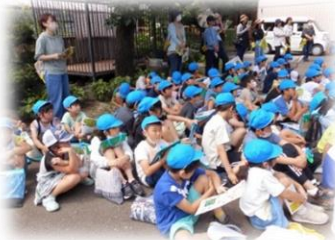
3年生 社会科見学の見守り