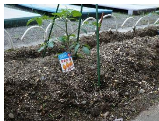
2年生のミニトマト