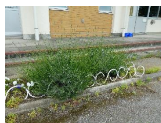
やよい学級のラベンダー