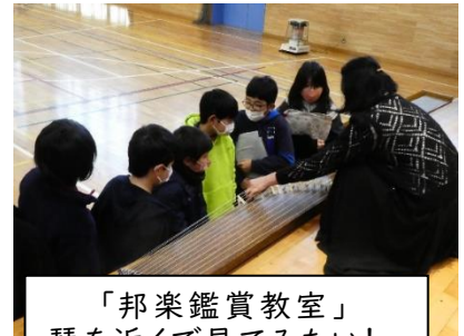
「邦楽鑑賞教室」 琴を近くで見てみたい!