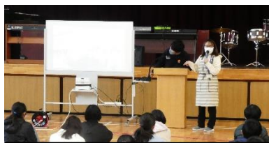
「キャリア教育」 初めて知ることがいっぱい。