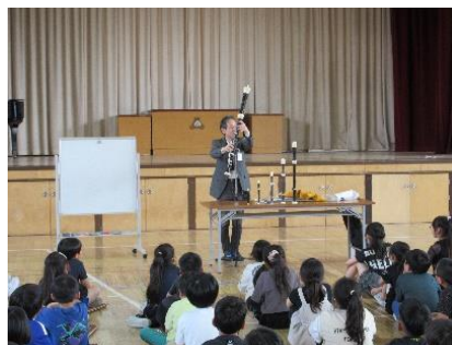
<3年生> はじめてのリコーダー体験