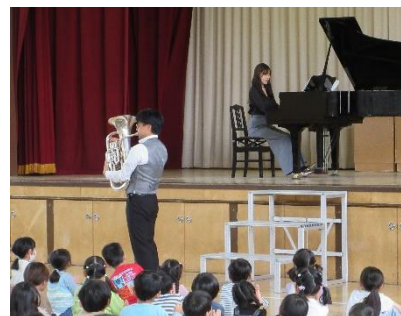
<1~4年生・さくら学級> 生演奏の迫力に心はずむ