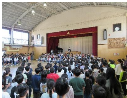
<全学年> 新しい仲間 ようこそ関沢小へ