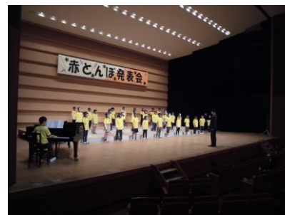
みんなで心を合わせました。

11月2日に、キラリふじみで、赤とんぼ発表会が行われました。当日、子供たちは、練習よりも少しだけ緊張気味でしたが、みんな真剣な表情で、精一杯歌っていました。今年は、新型コロナの影響で、様々な行事が中止となるなか、全校が一堂に会して行う貴重な機会となりました。子供たちが、素晴らしい舞台上、貴重な体験をさせていただけるのも、保護者・地域の皆様のおかげです。今年は、鑑賞していただくことができませんでしたが、心より感謝申し上げます。