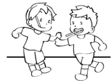
歯ブラシを口に入れて 歩くとあぶないよ