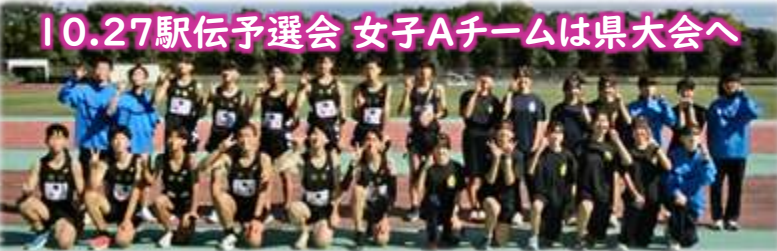
10.27駅伝予選会 女子Aチームは県大会へ

◆JOC全国水泳競技大会アーティスティックスイミング チーム第4位、デュエット第8位 ○○○○ ◆日本選手権水泳競技大会AS競技 テクニカルルーティーン・フリールーティーン出場 ○○○○