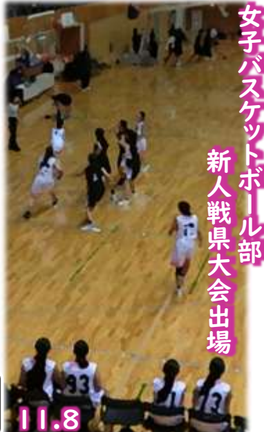
女子バスケットボール部 新人戦県大会出場

【お願い】雨天時に多数の駐停車が発生し、近隣の皆様にご迷惑をおかけしております。ケガなどの事情のない限り、雨天でも自力下校させるようお願いいたします。