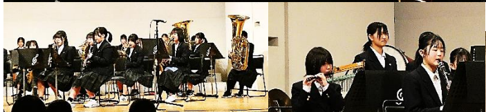
市内2年生による合同演奏