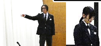
駅伝参加選手たちに「お疲れ様！」のひと言がかけられました