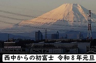
西中からの初富士 令和8年元旦

明けまして おめでとう ございます 2026(午年)、今年もよろしく願いいたします