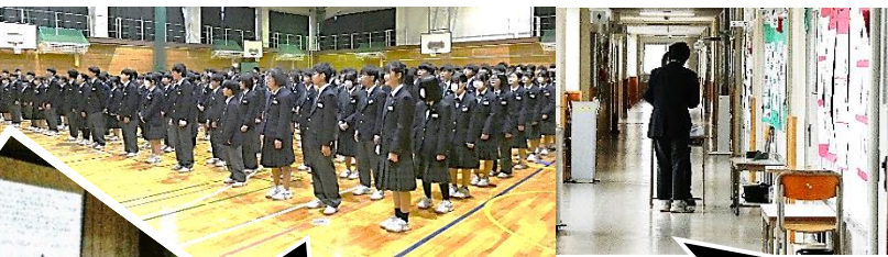
昨年末、2学期終業式の様子