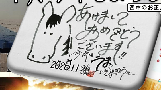
西中のお正月飾り…