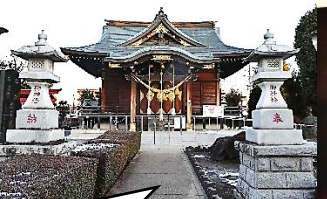
西中学区の氏神様…針ヶ谷氷川神社さんにも、新年のごあいさつをしてきました