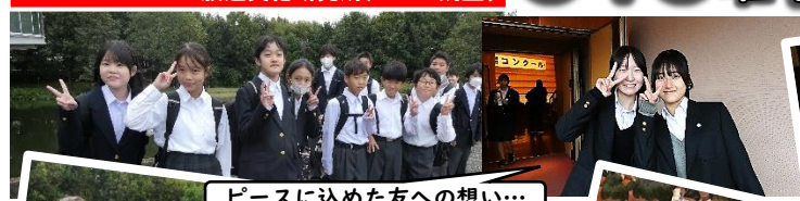
ピースに込めた友への想い…