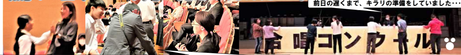
写っていない先生もいますが、全職員が合唱コン成功のために力を尽くしてくれました...感謝