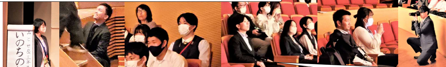
こんなに一生懸命な生徒たちと、生徒のために全身全霊を傾けられる職員がいる西中は、私の「誇り」ではない!