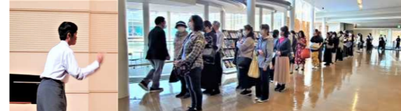
PTAの皆様、ありがとうございました