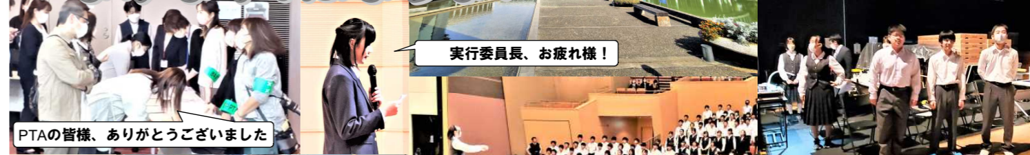
実行委員長、お疲れ様!