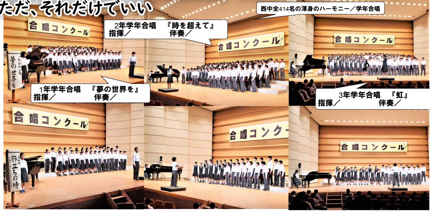
西中全414名の渾身のハーモニー/学年合唱

君たちの歌声は、家族への感謝となったのか... 君たちの歌声は、先生の顔を濡らすことができたのか... 君たちの歌声は、仲間を感動させることができたのか... そんなハーモニーを奏でることができたのなら... ただ、それだけでいい