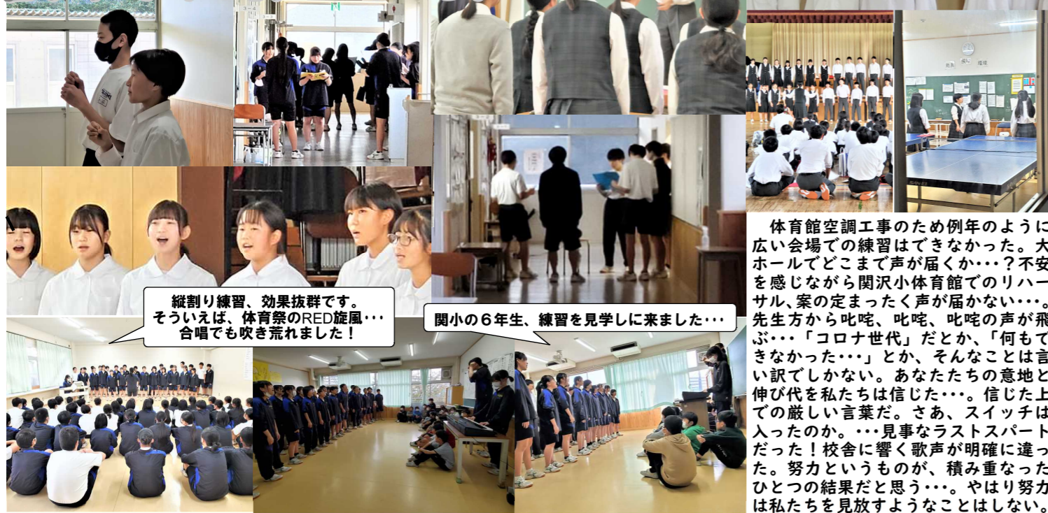
縦割り練習、効果抜群です。そういえば、体育祭のRED旋風...合唱でも吹き荒れました!

努力が必ず報われるなんて、思っていない...でも、努力を重ねなければ何も始まらないことなんか...、言われなくても知っている!