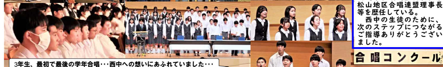
3年生、最初で最後の学年合唱...西中への想いにあふれていました...