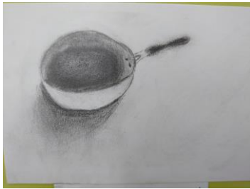
3年 「料理で使ったフライパン」

美術で「臨時休業中 がんばったこと」という題名で絵を描く課題が出されました。各学年から2作品ずつ紹介させていただきます。紙面の都合上、ごく一部しか掲載できませんが、ご了承ください。