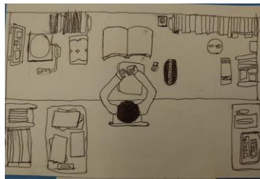
2年 「勉強を頑張りました」