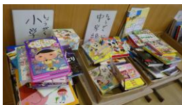
子供達が選んだ本

昨年度に実施して好評だった図書の見本展示会を今年度も行いました。学校で購入する本を子供達が実際に手に取って選ぶ…。というものです。今年は特に音の出る絵本を多く用意していただいたと伺いました。子供達はそれぞれ興味ある本を手に取り、熱心に見入っている姿が印象的でした。