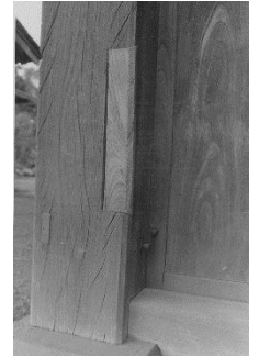
傷つけられた柱 (副木を当ててある)