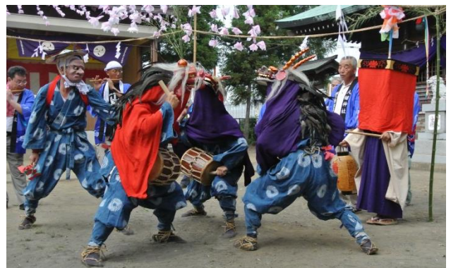
お庭節(2013 年、生涯学習課撮影)

穀蔵展示室では獅子舞の映像も見られます。間近ではなかなか見られない獅子頭や山の神の面などをこの機会にぜひご覧ください。（駒木敦子）