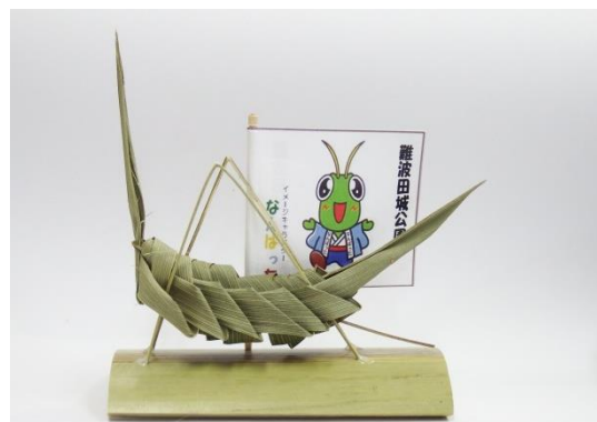
完成したシュロの葉バツタ