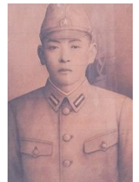
写真 2 父の肖像画

家に父に関する物はほとんど無く、戦後、若い頃の写真を基に書いてもらったという肖像画(写真 2)があるくらいです。