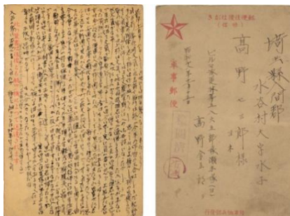
写真 1 戦地の父から送られたハガキ(本人蔵)

父の遺骨は戻らず、骨箱には木の位牌だけが入っていました。父を失った我が家の生活は大変でした。祖