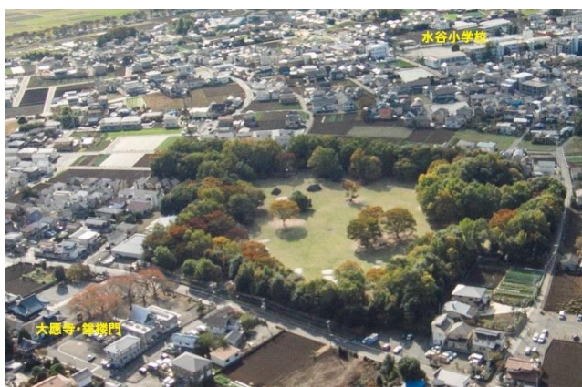
上：平成27年の航空写真 右：整備された水子貝塚公園

国史跡指定後の翌年から富士見町(当時)は、地権者で組織された水子貝塚保存会の協力を得て指定地の公有地化を始めました。