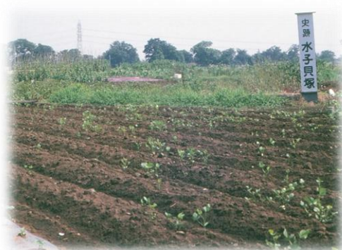
上：畑地の中の史跡看板 左：昭和45年頃の航空写真（線は史跡指定範囲）

水子貝塚は、かつては麦や人参、牛蒡などが収穫できる肥沃な農地でしたが、埼玉県に海が広がっていた縄文海進期を代表的する遺跡として、昭和44年(1969)9月9日に国史跡に指定されました。