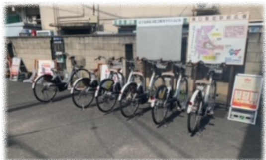
鶴瀬駅東口のサイクルステーション