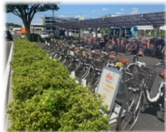
市役所のサイクルステーション