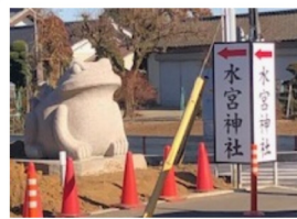
路面に面したカエルの石像

私は昭和52年(1977年)4月に御神縁により当地にお世話になって、早45年になります。当時はまだ蛙(かえる)が庭に飛び回っていました。家族の話によると、水谷小学校の校歌を作った時、水谷の歴史等をつぶさに調査し、自ら書き綴り、冊子を作成して、冊子を貸し合っていました。その冊子が盗まれたところから、