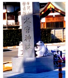
参道横の2匹のカエルの石像