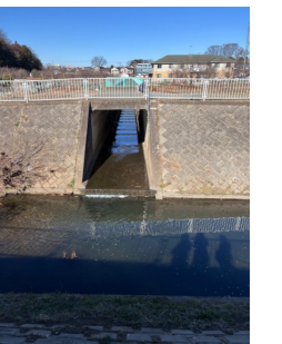
細い権平川の水が江川に注ぐ