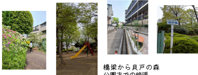
橋梁から貝戸の森公園までの暗渠

大きな木々が出迎えてくれる公園です。滑り台などの遊具もあり子どもと一緒にのお散歩におすすめです。暗渠沿いには季節の花が咲き、歩く度に表情が変わります。