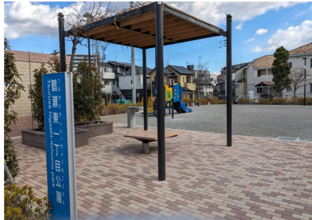
鶴瀬東一丁目公園