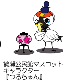
鶴瀬公民館マスコット キャラクター 『つるちゃん』