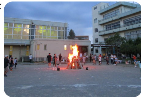
(豆の木学校担当者)

8月18日(金)～20日(日)、4年ぶりに豆の木学校が開催されました。3日間猛暑が続きましたが、水谷東小学校の体育館には空調設備が整えられたため、子どもたちは体育館で思いっきり楽しんでいました。最終日の夕方からは、恒例のキャンプファイヤー。子どもたちだけでなく、指導員、OB・OGなどなど、大人数で火を囲み、世代間交流を通して貴重な時間を過ごすことができました。これもアツい夏の思い出となりました。