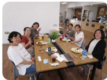
素敵なランチタイム

コーヒー類、ハーブティー、レモネードなど、お味もお値段も専門店並みで、メニューは大人向けです。子どもにちょうどよい小腹を満たすような軽食類はないので、食べ盛りのお子さんがいるファミリーは食べ物の持参をおすすめします！