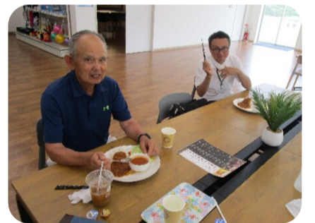
スパイシーなキーマカレー