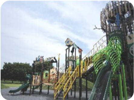
(展望台・複合遊具)

7月7日(金)、公民館だより編集委員会でびん沼自然公園へ取材に行ってきました。びん沼自然公園はパークゴルフ・キャンプ場・展望台・総合遊具・BBQエリアもあり、大人も子どももペットも楽しめる複合施設です。私たちはまず、パークゴルフを体験。その後カフェの中で涼みながら昼食をとり、大きな遊具をみてまわってから帰路につきました。35℃以上という酷暑の中での取材となりましたが、みんなで公園を満喫することができました。