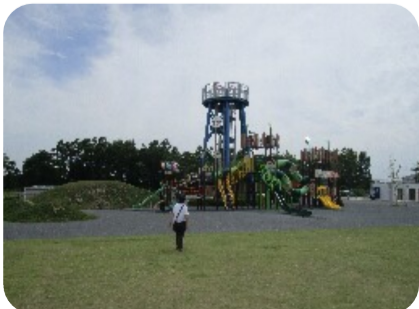
子どもは夢中になりそう！

後で調べてみたら高さ13mで4階建てのビル相当と高めですが、ちょっとした達成感や開放感が味わえるのでおすすめです。ただし、下りも階段なので自分の膝にご相談を。