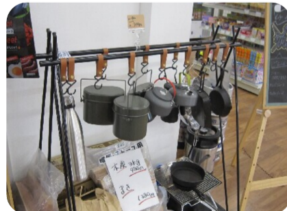
キャンプ用品たち