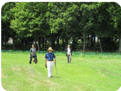
歩くだけでもいい運動♪