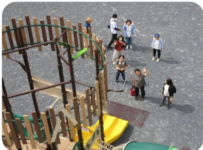
足がすくむほど高い…