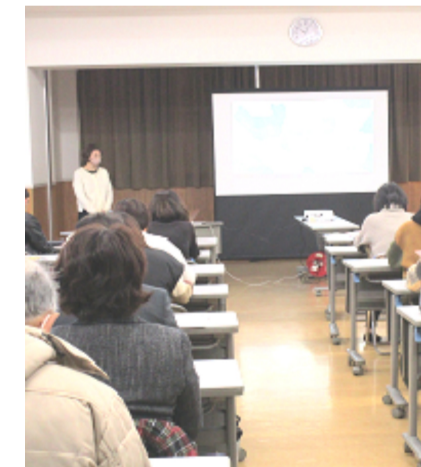
子育て応援の勉強室