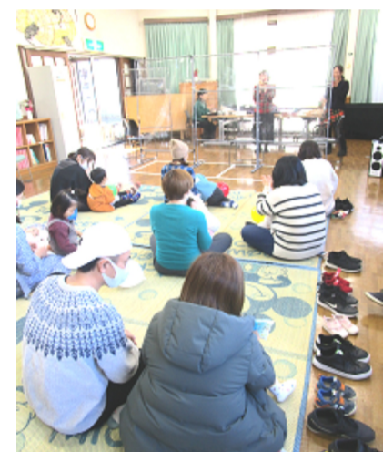
子育てサロンミニミニコンサート・パパの姿も♪