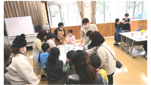
親子DE陶芸教室・パパもママも興味津々