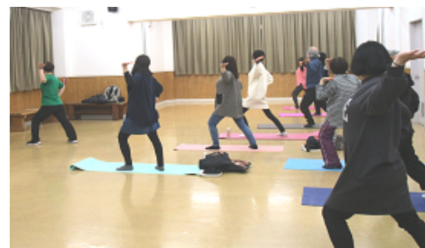
好評の仙人体操教室