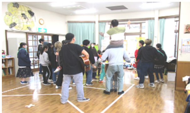
歌と踊りで盛り上がる冬の豆の木学校