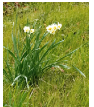
水仙(新河岸川土手)