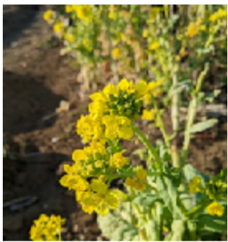
菜の花(榎町の菜園)

中学生になったら、勉強がもっと難しくなったり、新しい友達ができるのか…など不安なこともたくさんありますが、今までできるようになったことを生かして、部活や勉強にはげみ、楽しい中学校生活にしたいと思います。