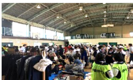
体育館でのバザール

新たな役割というのは、昨日までの自分にはない責任を持つことに他なりません。PTA会長を務めさせて頂いたというのには、私にとって、成長する必要がある、一歩前に踏み出した挑戦であり、自分自身の人生にも影響を与える前向きな変化です。まずは、PTA活動を通じて皆様のご指導の下に学び、子どもと大人と地域と学校とを