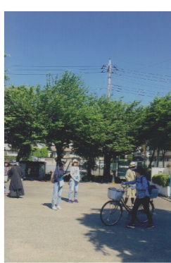
運動会での自転車整理

新米PTA会長ではございますが、地域活動に積極的に参加し、いろいろな人たちと交流を深められたらと思っておりますので、一年間どうぞよろしくお願いたします。