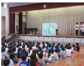
大型絵本の読み聞かせ

動を通して学校と保護者、そして地域をつなぐ架け橋となり子どもたちが安全で安心して過ごせる環境をつくることだと思っております。皆様のご理解とご協力をいただきながら、子どもたちの「笑顔」のために精一杯頑張りたいと思っております。一年間、どうぞよろしくお願いたします。