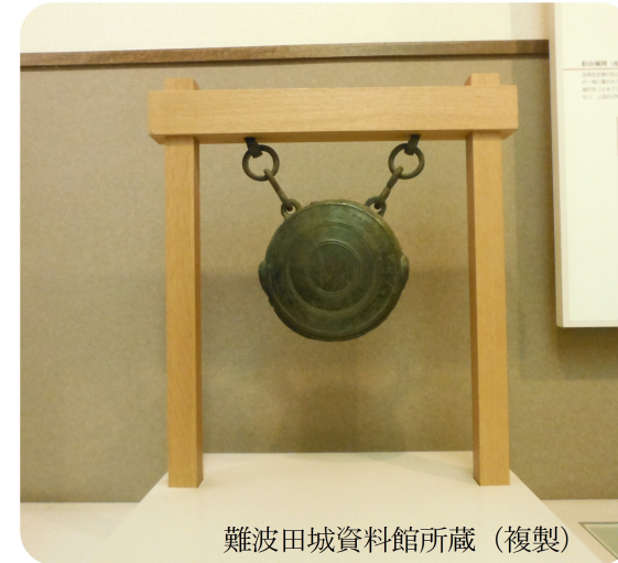
難波田城資料館所蔵(複製)

Q2 下南畑の興禅寺境内にあり、葉の裏にとがったもので傷をつけて黒く変色させ、文字がかけることから「葉書の木」とも言われている木の名前は何か？