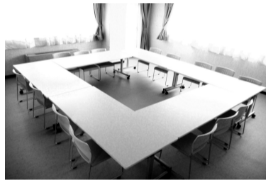
使いやすくなった会議室