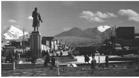
エル・アルト付近から見たワイナポトシ山(左側)

一九七六年六月から仕事で南米ボリビアに行きました。直行便はなくサンフランシスコとリマで乗り継ぎのため宿泊し、空路二八時間、初めての渡航でした。一ドルが二八〇円ぐらいの時代です。 ボリビアは国土の1/3近くをアンデス山脈が占め、六千メートル級の高峰が一六座ある高原の国です。首都ラパスは富士山頂よりやや低い三六五〇メートルに位置する街で、ここに二年間滞在しました。 休日にはウユニ塩湖、ポトシの銀山、ティワナク遺跡、そしてマチュピチュなどに行きましたが、何をしても圧倒され感動しました。 しかし今でも一番印象に残っているのは、最初に降り立ったラパス・エル・アルト国際空港から見た真白なワイナポトシ山とリアル山脈です。 もう一度旅したい思い出の地です。