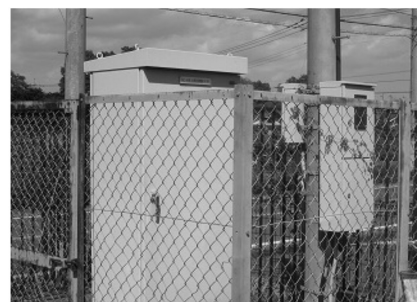
水子路上局(水子貝塚公園付近)

いう施設が、市内に6か所あり、そのうち1つが水子貝塚公園に隣接して設置されています。