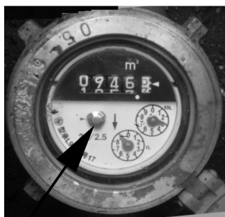
パイロットマーク(星印)