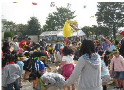
子どもたちによる玉入れ