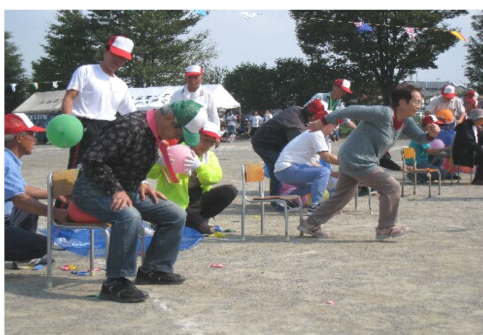
風船を割ってダッシュ！血圧測定