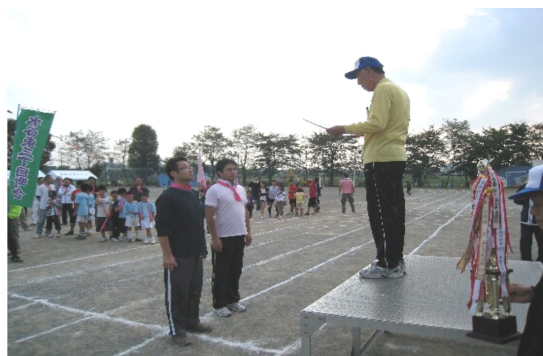
閉会式。優勝した榎町チームに賞状。

水谷東地区体育祭は、各町会から選出された総勢90名の実行委員により運営されています。総務・競技・審判・会場整理・放送進行などの役割分担により、会議や事前準備が積み重ねられ、当日を迎えます。体育祭の運営を支える縁の下の力持ちです！