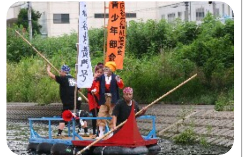
準優勝の「水谷東黄門号」

7月24日(日)、夏の風物詩「やなせ川いかだラリー」が開催されました。今年は9チームが参加し、個性豊かないかだパフォーマンスを披露しました。今回は開会にあたって、地区社協の音頭で参加者全員で東日本大震災の被災地にエールを送りました。また当日募金箱を設けて集められた11,327円は、東日本大震災被災地支援活動応援金に充ててもらうために、後日富士見市役所へ届けられました。 最近では水谷東以外の地域の若いお父さん、お母さん、子どもたちのチームの活躍が目立ちます。来年は記念すべき20回目となりますので、ぜひ地元水谷東地域のチームの参加をお待ちしています!