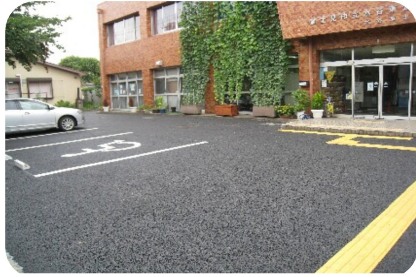
緑のカーテンがよりきれいに見えます

水谷東公民館敷地内駐車場の舗装工事が7月中~下旬に行なわれ、でこぼこのない、きれいな駐車場に生まれ変わりました。 工事期間中は、公民館利用者の皆さま始め、多くの方々にご協力・ご配慮をいただきました。厚くお礼申し上げます。