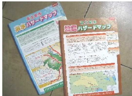
富士見市のハザードマップ

■荒川・新河岸川洪水ハザードマップ ■新河岸川・柳瀬川洪水ハザードマップ ■荒川・入間川・新河岸川・柳瀬川合成ハザードマップ1・2