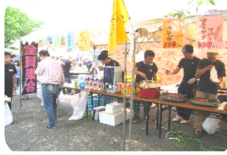
「全員集合!!」子どもたちのために頑張りました

各町会、地区社協合わせて200万円を超える義援金が寄せられています。また、水谷東公民館利用サークル間でも義援金募金活動が行なわれ、169,211円(34サークル)集まりました。さらに5月29日(日)水谷東地区社会福祉協議会主催のチャリティバザー(上記)があり、義援金として500,000円(含バザー収益181,392円)。6月5日(日)には水谷東2丁目第三富士見自治会による「子どもチャリティーバザー」が開催され、子どももおとなも楽しく美味しいひとときを過ごしました。