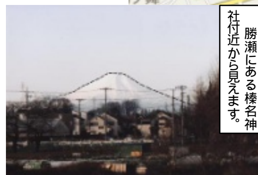
社付近から見えます。