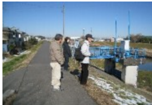
3丁目土手で野鳥を探す

帰りは、のんびり歩き、ところどころで咲いている梅の香りで、春を感じ、ぶらっと、お散歩、終了。(本田編集委員)