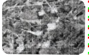
田んぼのあぜ道に咲くオオイヌノフグリ