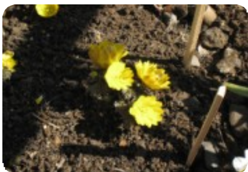
難波田城公園の長屋門に咲いていた愛らしい福寿草。

水谷東公民館 3丁目新河岸川土手 1丁目青空広場 釣り堀 岡坂橋 新河岸川左岸土手 難波田城公園 富士見川越線出口 袋橋