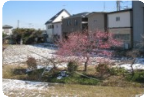
木染橋付近の土手に咲く紅梅