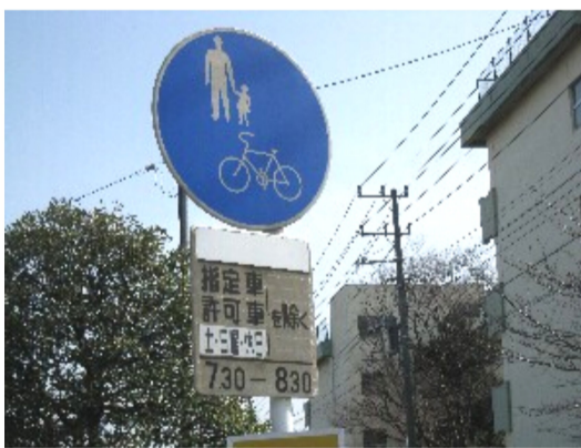
「歩道通行可」の標識(水谷東小学校前)

道路交通法に基づく罰則規定もありません。例えば無灯火や傘さし運転は『5万円以下の罰金』、信号無視や一時停止違反は『3ヶ月以下の懲役又は5万円以下の罰金』です!ご存知でしたか?また人身事故による多額の損害賠償請求の例もあります。自動車と同じように左側通行に心がけ、一時停止や信号、道路標識にあるルールを守りたものです。 (編集委員会)