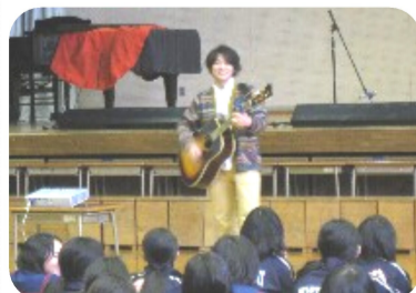
水谷中体育館でミニライブ