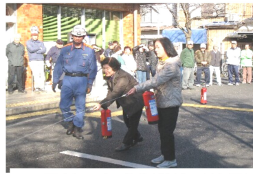
公民館でも消防訓練(12月)

東日本大震災から1年。義援金募金活動・計画停電・震災復興応援バザー・夏の節電・放射線の問題など、思い起こせば色々なことがありました。震災復興の取り組みは現在各地で進行中。そんな中で最近、「マグニチュード7を超える首都圏直下型地震が4年以内に70%の確立で起こる」という研究結果が話題になり、気になる場所です。