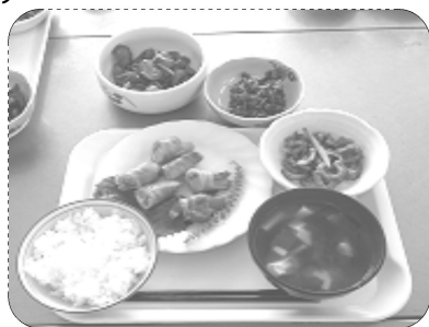
ゴーヤでおかず3品

☆裏面に「イケてる男の簡単料理教室」の案内があります。 ただ、ごちそうさまでした。いろいろでしたが、おいしくいただきます。 ての人から、〇〇回目の人まで料理初め 肉巻、 ゴーヤの かぼち の佃煮 ☆ゴーヤ れました が開催さ 6にメンズ7名による料理教室 いのかな?」の声と、緑のカー ◎「水谷では男の料理教室はな 紙をコツコツコツコツ折ってま す☆ご興味のある方は公民館へ ご連絡ください。