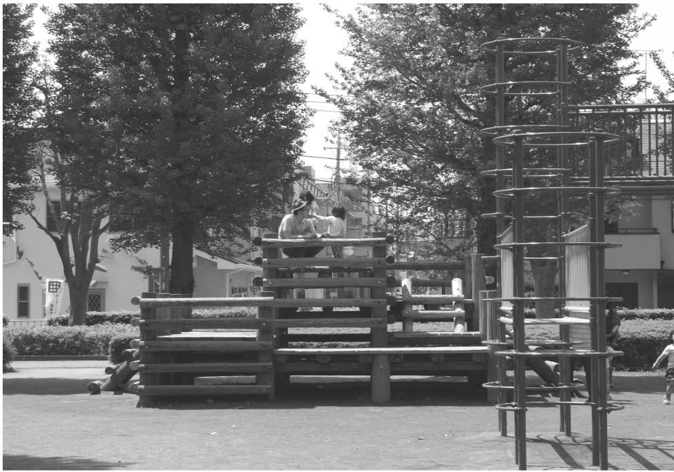
みずほ台中央公園の遊具広場

特に桜の季節は、お花見でにぎわいます。アスレチック、すべり台、ブランコ等がある遊具広場、自由に遊べる多目的広場、今の時期は水遊びができる徒渉池等、思い思いに遊ぶことができます。広場の周りには、桜の木が多く、木陰で休むことも出来るので、赤ちゃん連れのファミリーにも適しています。トイレ(二か所)はもちろん、水飲み場や飲み物の自販機(二台)も設置されているので、藤棚の下ベンチやあずまやで、お弁当を広げ、ちよつとしたピクニック気分を味わうことも出来ます。公園内を一周できる園路も整備されているので、運動不足を解消するウォーキングにも最適です。