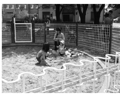
みずほ東公園の囲いのある砂場

*取材を終えて* 子どもが小さい頃は、毎日のように通った中央公園。十七、八年ぶりに訪れた公園は、休日のせいかわ、パパ達も子どもと遊ぶ微笑ましい光景が本場に多く、心なごみしました。「中央公園の砂場には、猫が入って不衛生になるので、困いをしてほしい」という母親たちの