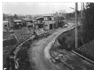
S41年、現水子貝塚公園前の信号から寺下住宅へ

・打越公園付近に斜面林が広がっており、子どもが、カブトムシをとったりしていました。水子の神井戸は、斜面に樹木があり、周りから湧き水がにじみ出て静寂感のある風景でした。またその下に広がる田んぼの畔には、セリが自生し、小川(現東桜井都市下水道)には、ドジョウや小ブナなどが見られました。