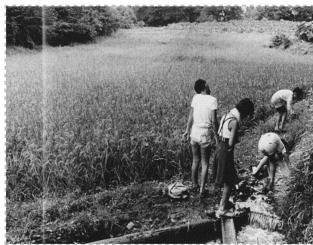
S52年頃、区画整理前の針ヶ谷(右上手が栗谷津の湧き水)

み交わしながら情報交換や農作物の作付けについて話合っていました。 ・自分が20歳くらいのころ(昭和50年頃)4Hクラブ(農業青年の組織)の会合などで水谷公民館によく若者たちが出入りしていました。 ・都市化が進み、新住民との交流は、特に公民館等が中心となって行われるようになってきました。