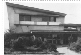
当時の水谷公民館

・青年団、青年学級等があり、公民館を中心に集まって楽しくコミュニケーションがとれていたと思います。 ・娯楽施設がないため、各種団体等にそれぞれ参加し、集会所、公民館、個人宅で楽しく酒など酌