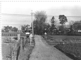
S40年代のみずほ台踏切 (西みずほ台から並木方面)

・西みずほ台地区では、区画整理をしていたので、荒地で草ぼうぼうでした。犬を放すと姿が見えなくなるくらいでした。