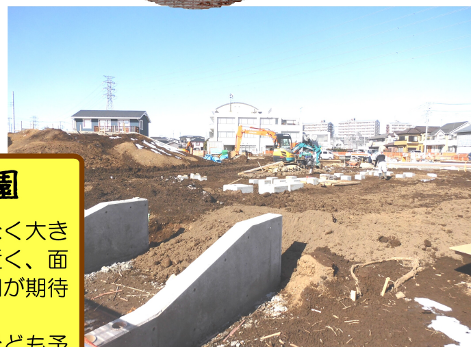
昨年10月に始まった工事は、本紙作成中も進行しています。期間中は、大雪に見舞われた日も。

鶴瀬西交流センターの隣に、まもなく大きな公園が誕生します。鶴瀬駅からも近く、面積も大きいため、今後さまざまな活用が期待されます。 春には、オープンを記念した式典なども予定されているそうです。