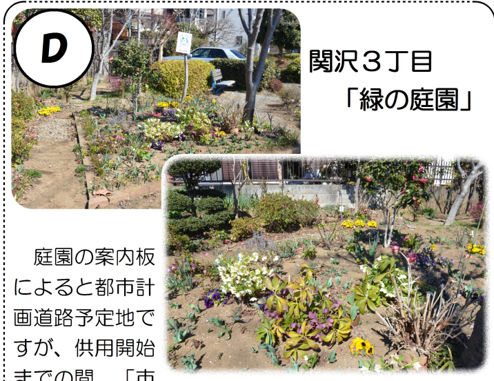
関沢3丁目 「緑の庭園」

庭園の案内板 によると都市計 画道路予定地で すが、供用開始 までの間、「市 民の庭園」として開放され活用されています。